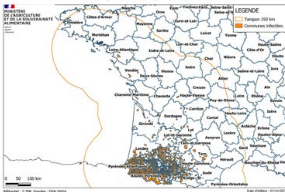
MALADIE HEMORRAGIQUE EPIZOOTIQUE (MHE) : FOYERS EN FRANCE