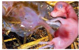
Durée de vie : 5 ans